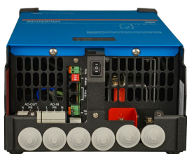
MultiPlus 2000 VA (alakansi irrotettuna)